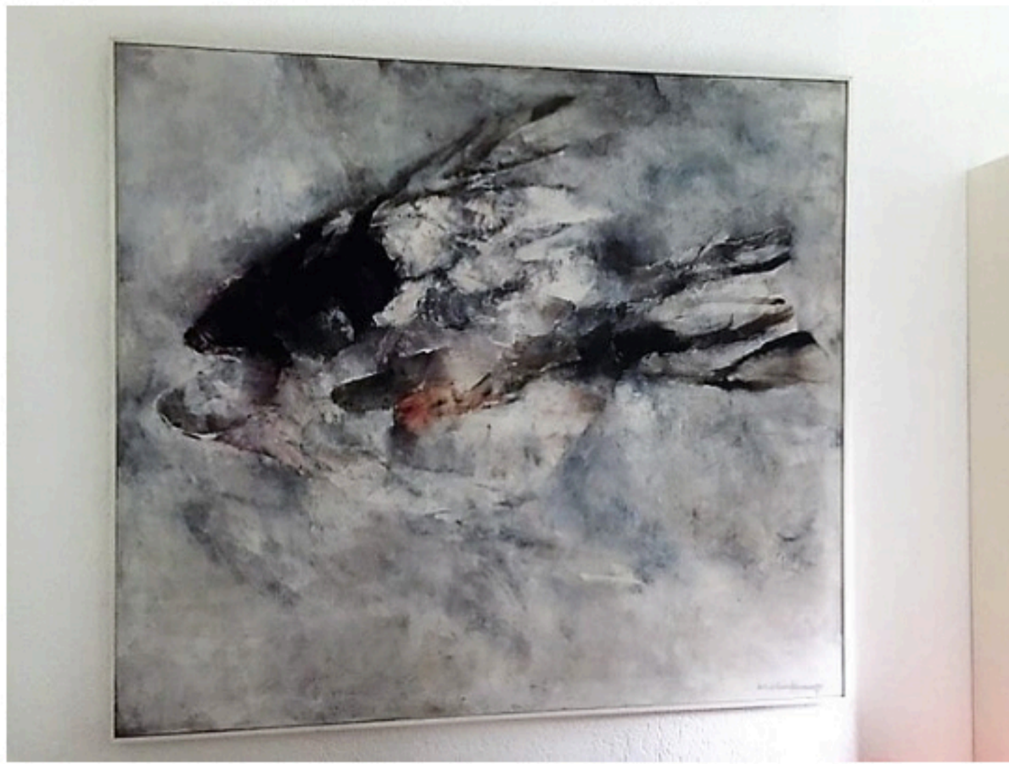
DE VIS DOOR NICO MOLENKAMP