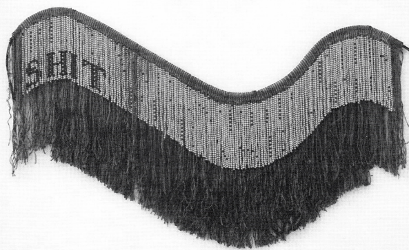
Larissa Schepers, Please stop this, shit please stop , textiel