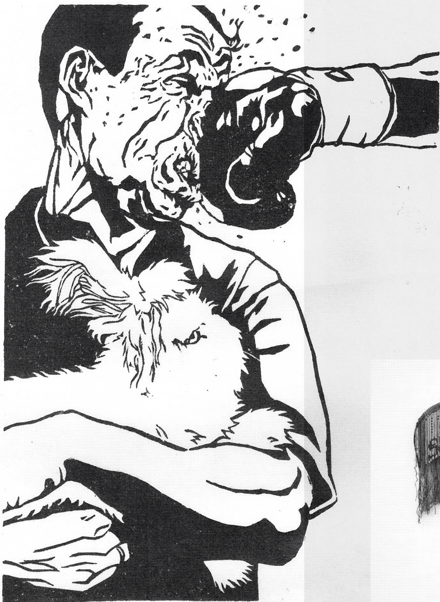
Ivo van Leeuwen, Voltreffer met Konijn , lino snede