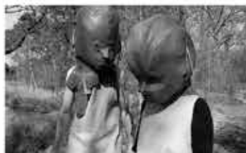
Sylvie Zijlmans & Hewald Jongenelis [zaal] The Mother Of All Failure 2023 video, 06:50 min