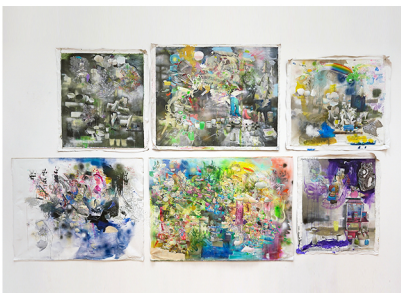
Frederique Jonker -Nog zonder titel -Language falls apart above the sixth dimension -Rainmaker -Cerulean -40 days and 40 nights -Merya's gambit gemengde technieken