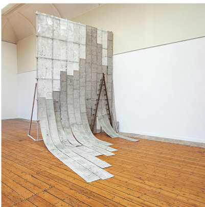
Maaïke Kramer Muur/Fragment 520 x 360 x 500 cm flexibel beton, houtlijm, hout, malmateriaal en latex