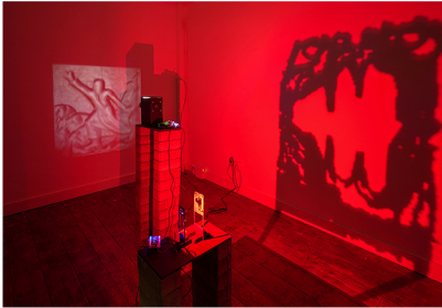
Anna Sandri '[...]lone swimmers in the surges grey' mixed media installatie, unieke projectoren, microcontrollers, bakstenen, hars- en kleireliefs.