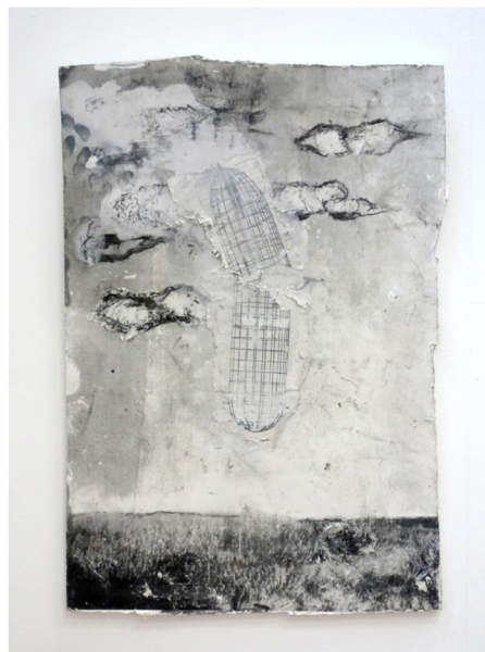
Joran van Soest

Ook Cas van Deurssen laat het dagelijks leven een rol spelen in zijn werk, maar in zijn geval gaat het om objecten die oorspronkelijk vaak een omschreven functie en een heldere vormgeving hebben. Van Deurssens werken zijn collageachtig. De objecten krijgen er een meer esthetische rol toebedeeld. Geheel disfunctioneel maakt hij ze niet, want ze krijgen een functie binnen het kunstwerk. Daarmee krijgen ze ook een nieuw karakter en een nieuwe betekenis. In de twee werken in de tentoonstelling, een groot drieluik Utopia Inn , en de kleine, vierdelige serie Magic moments / Grocery store , biedt hij als het ware twee etalages waarin schijnbaar iets wordt aangeboden, voor zover geen begerenswaardige objecten dan toch een begerenswaardige sfeer. Die begerenswaardige sfeer wordt bevestigd door de titels, maar blijft ongrijpbaar. Van Deurssens toon is speels, tongue-in-cheek, maar daarachter verschuilt zich ook een volslagen eigen wijze van tegen de wereld en het dagelijks leven aankijken, waarbij de esthetiek van de werkwijze de betekenissen van de objecten in het werk doet verschuiven.