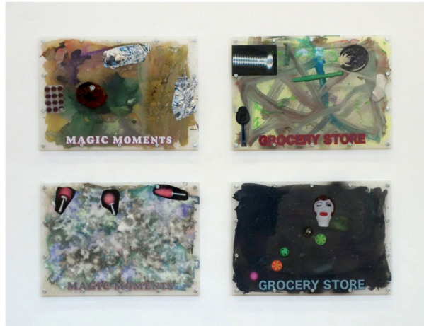
Cas van Deurssen

Ook Cas van Deurssen laat het dagelijks leven een rol spelen in zijn werk, maar in zijn geval gaat het om objecten die oorspronkelijk vaak een omschreven functie en een heldere vormgeving hebben. Van Deurssens werken zijn collageachtig. De objecten krijgen er een meer esthetische rol toebedeeld. Geheel disfunctioneel maakt hij ze niet, want ze krijgen een functie binnen het kunstwerk. Daarmee krijgen ze ook een nieuw karakter en een nieuwe betekenis. In de twee werken in de tentoonstelling, een groot drieluik Utopia Inn , en de kleine, vierdelige serie Magic moments / Grocery store , biedt hij als het ware twee etalages waarin schijnbaar iets wordt aangeboden, voor zover geen begerenswaardige objecten dan toch een begerenswaardige sfeer. Die begerenswaardige sfeer wordt bevestigd door de titels, maar blijft ongrijpbaar. Van Deurssens toon is speels, tongue-in-cheek, maar daarachter verschuilt zich ook een volslagen eigen wijze van tegen de wereld en het dagelijks leven aankijken, waarbij de esthetiek van de werkwijze de betekenissen van de objecten in het werk doet verschuiven.